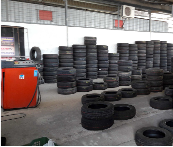
Área de clasificación y puesta a punto de neumáticos para el mercado de segunda mano.

En la valorización material se utilizan tanto neumáticos enteros, por ejemplo en la construcción de taludes, como triturados, siendo ésta última la forma más habitual de utilización.